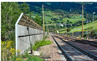
Barriera antirumore linea ferroviaria Verona-Brennero