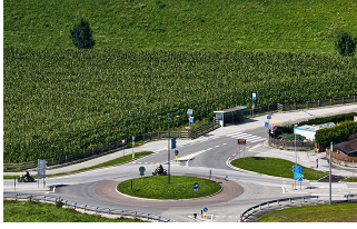
Errichtung Kreisverkehr auf der Staatsstraße SS44